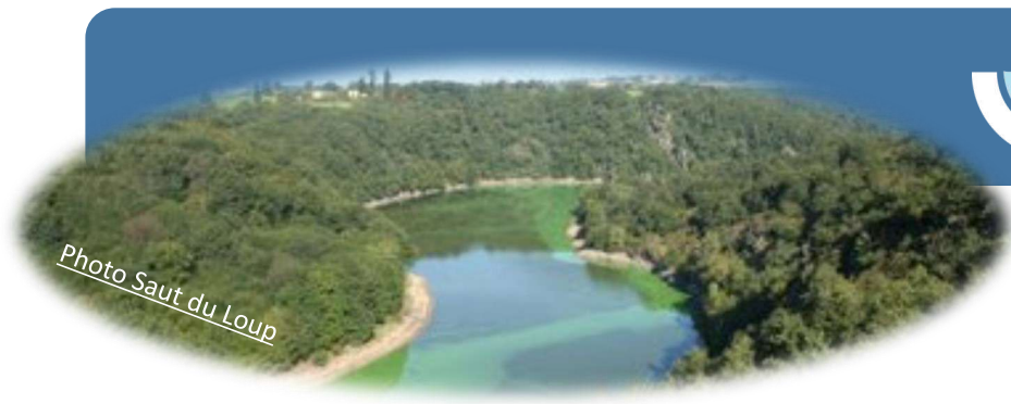
Photo Saut du Loup